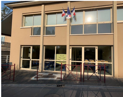
Avant la pose