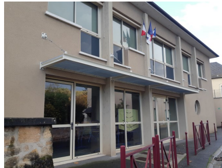
Après la pose