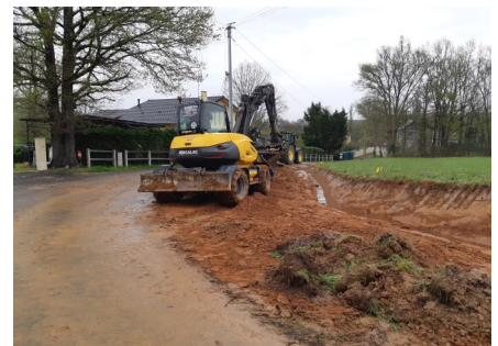
Pendant les travaux