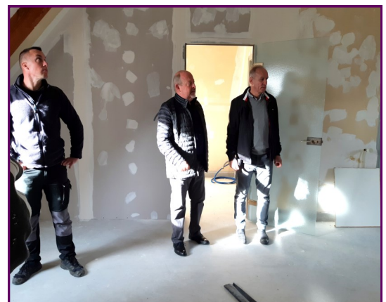
M. Le Maire et M. Gilet adjoint suivent les travaux

Le réaménagement de l'étage est en cours et permettra d'accueillir des réunions de 19 personnes.